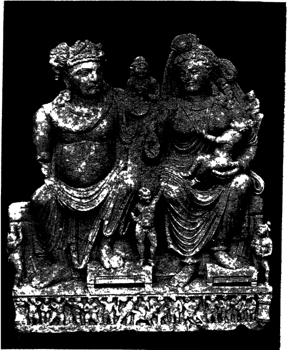
गांधार—पञ्चक और हरीती